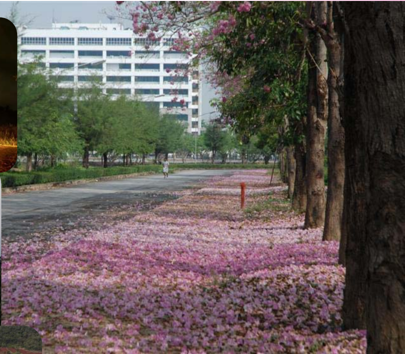
บริเวณจุดที่สูงที่สุดในวิทยาเขตกาญจนบุรี โดยมีความสูง 325 เมตร จากระดับน้ำทะเล